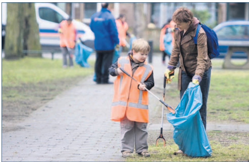
Deze jongen zet zich in als vrijwilliger tijdens een project van NL DOET

Zeven leerlingen uit de tweede klas van het Christelijk College